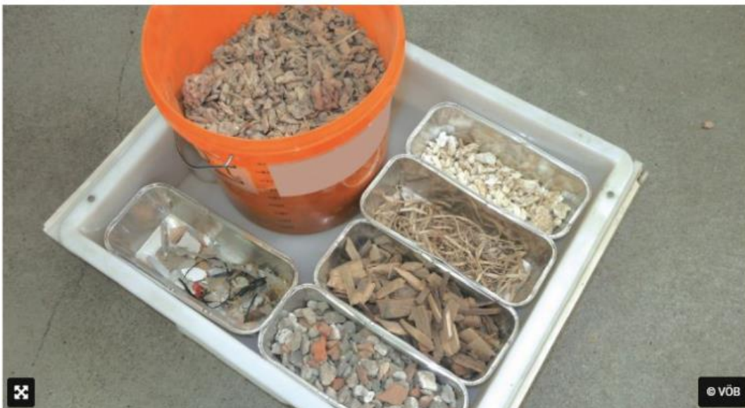
Materialien nach der Trennung

Auf Basis wissenschaftlich begleiteter Versuchsreihen der bvfs formulierte der VÖB eine Richtlinie, wie eine Trennung in Leicht- und Schwerstoffe des Abbruchmaterials durchzuführen ist. Das Ergebnis des empfohlenen Recyclingverfahrens ist zum einen ein Schwerstoff (Betonbruch aus dem Kernbeton), der bis zur höchsten Qualitätsklasse U-A gemäß Recycling-Baustoffverordnung reicht. Zum anderen bieten sich die aussortierten