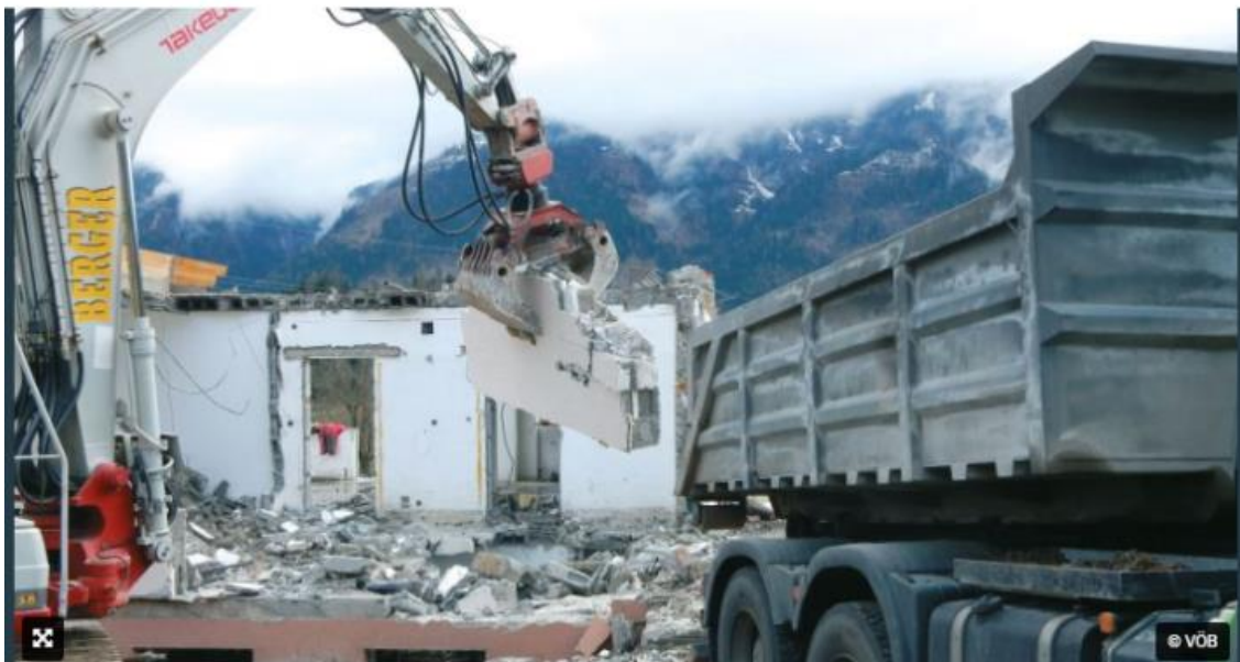
Abbruch eines Holzbetonhauses

Der Verband Österreichischer Beton- und Fertigteilwerke (VÖB) hat erstmalig eine Richtlinie zum Recycling von Holzbetonbauteilen erstellt. Auf Basis von Versuchen, durchgeführt durch die Bautechnische Versuchs- und Forschungsanstalt Salzburg (bvfs), zeigt die Richtlinie die Aufbereitung des Baustoffs nach dem Abbruch und Anwendungsmöglichkeiten des Rezyklats auf. Damit fördern die Hersteller von Holzmantelbetonsystemen im VÖB den nachhaltigen Umgang mit ihrem Baustoff. Anstatt bisher weitgehend üblicher Deponierung werden die Baumaterialien effizient wieder genutzt.